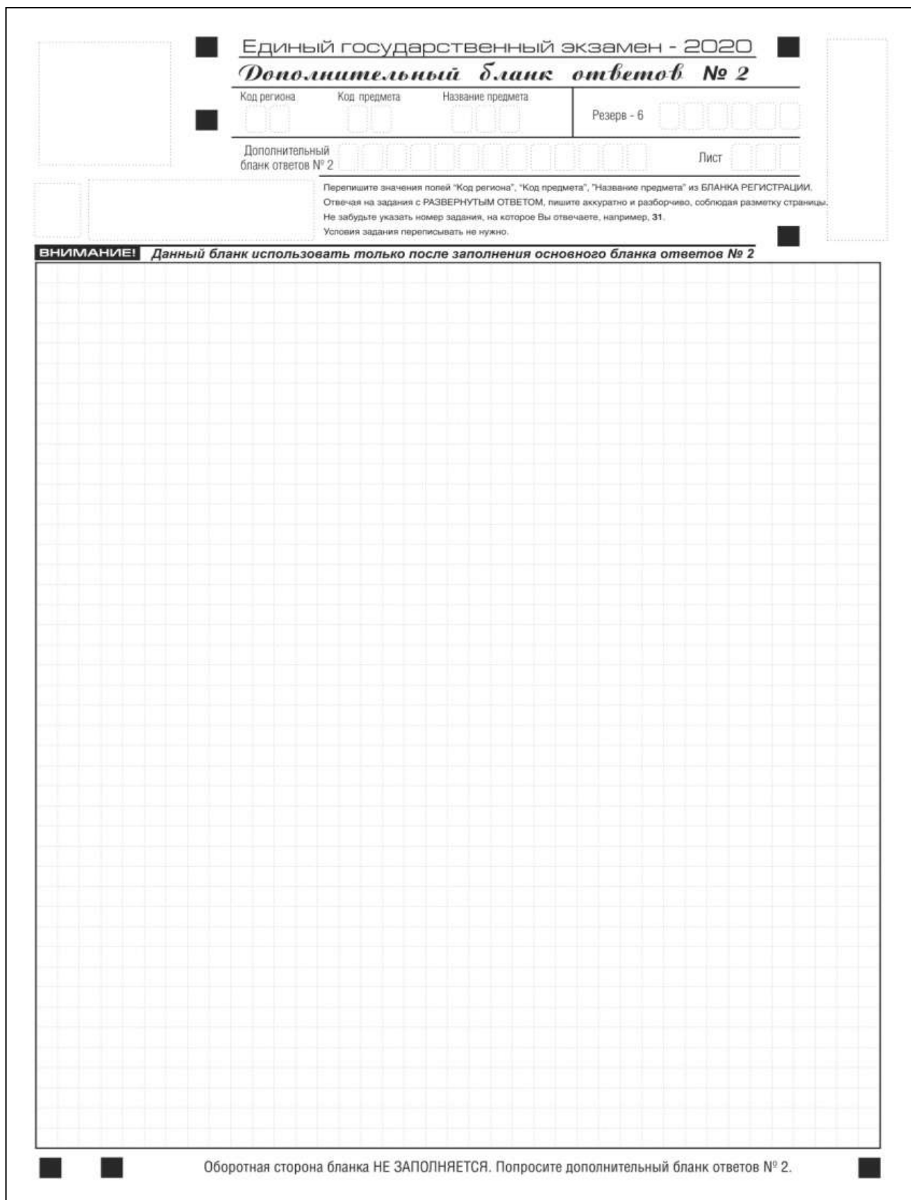
Рис. 15. Дополнительный бланк ответов № 2